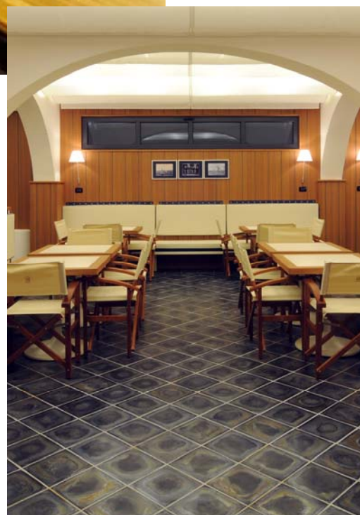
Yacht club Itálie (250/250/22JRI)