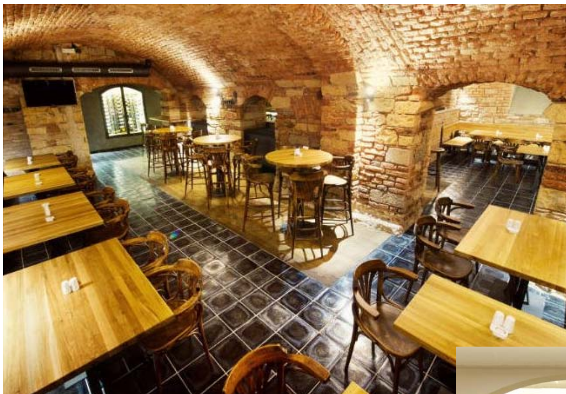
Restaurace Ostrovní Praha (250/250/22JRI)

Zajímavé je i použití pro podlahové vytápění vzhledem k výborné tepelné vodivosti a dobré akumulaci dlažeb z taveného čediče.